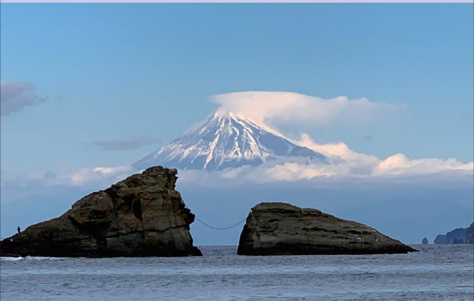
海に浮かぶ富士(伊豆 雲見海岸)